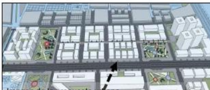
Imagen de la propuesta urbana