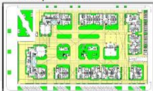
Plano de la primera planta