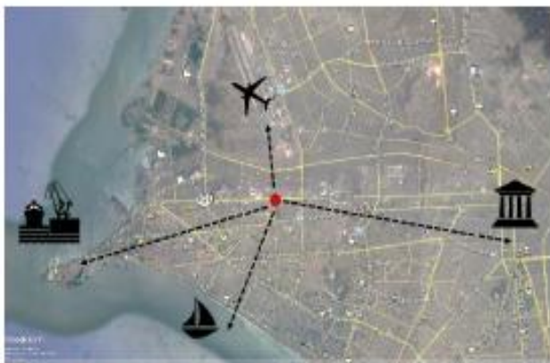
Plano de localización con las zonas circundantes