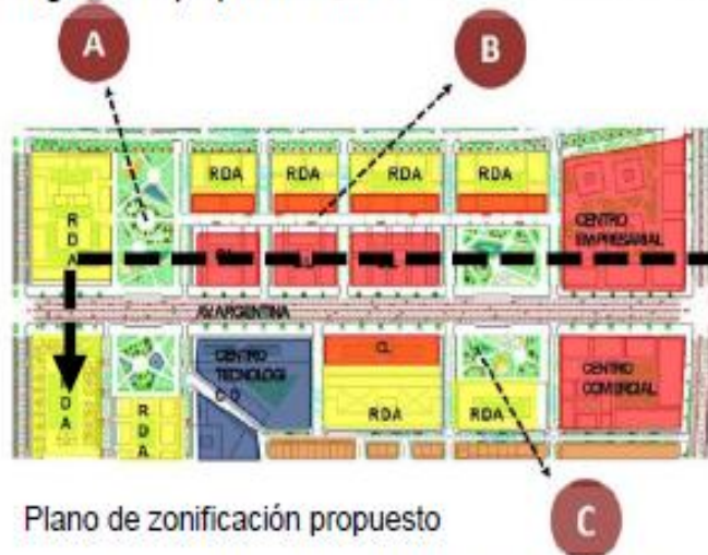
Plano de zonificación propuesto