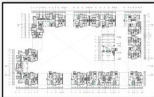
Plano de la segunda planta