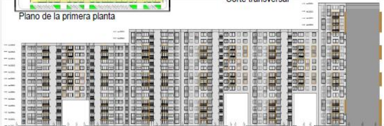
Elevación interior por la avenida Los Insurgentes