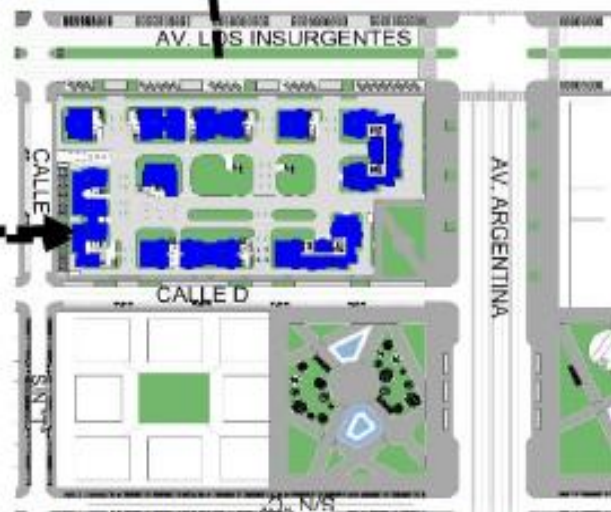
El Proyecto Conjunto Residencial "Los Jardines del Callao" cuenta con once torres de viviendas