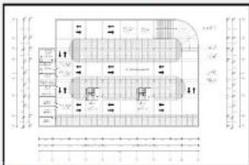
Plano del segundo sótano